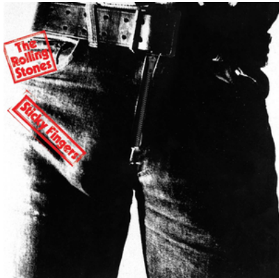
Albumcover, Andy Warhol en John Pasche, gefotografeerd door Billy Name.

... Kunstenaar Andy Warhol de legendarische hoes van Sticky Fingers bedacht? Hierop staat een man in strakke jeans.